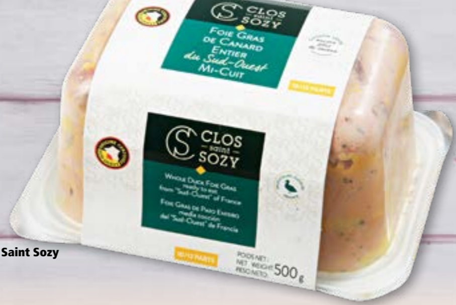
446352 Foie gras de canard Clos Saint Sozy entier, mi-cuit