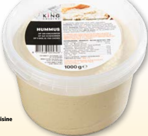
80104 Humous nature King Cuisine