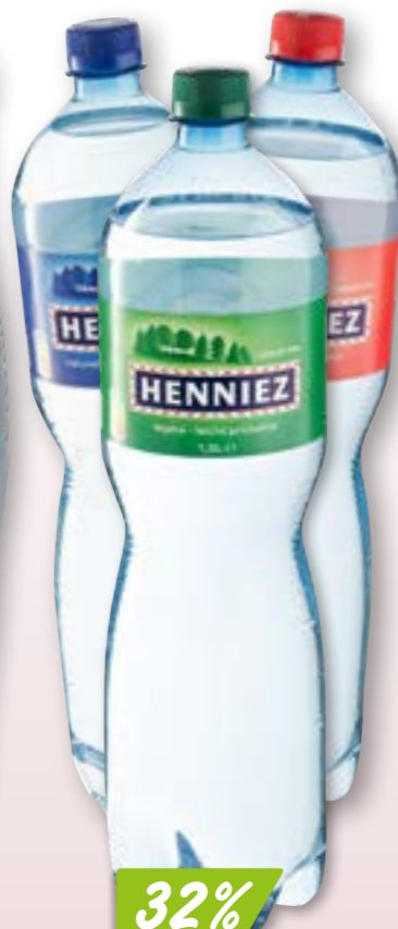
Henniez diverses sortes 12 x