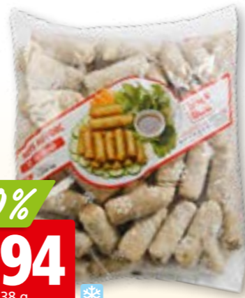
79702 Nem au porc surg.