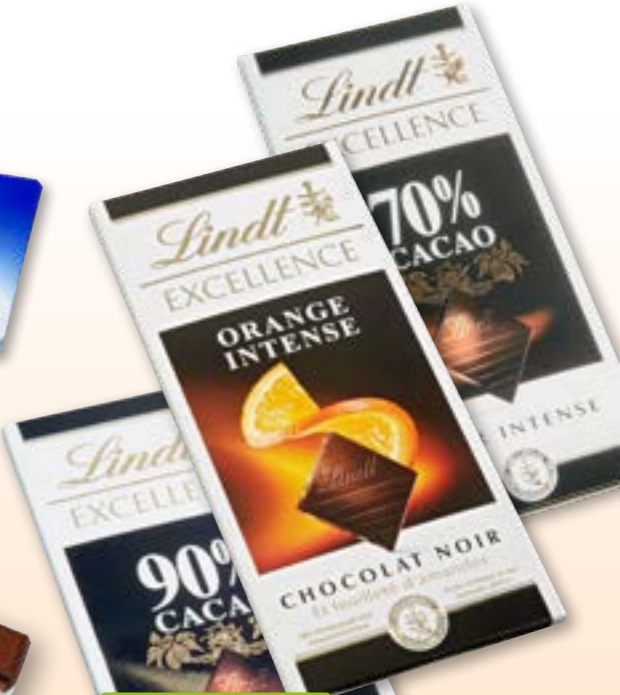
Chocolat extra au lait Lindt 20 x