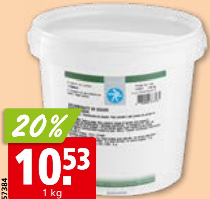
Gélatine en feuilles argent Gelita