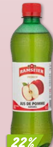
Schorle Ramseier 24 x