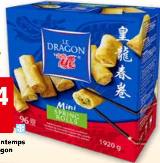
267160 Minirouleaux de printemps aux légumes Le Dragon surg.