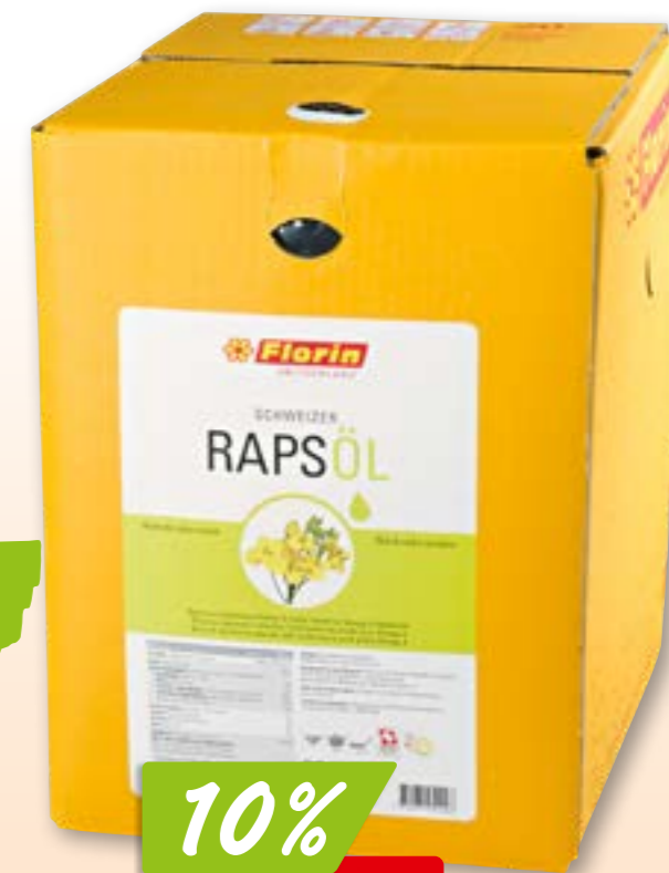
Huile de colza suisse Florin 4 x