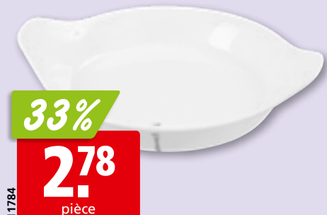
Miniramequin ou minisoupière Tête de lion en porcelaine, 6 x