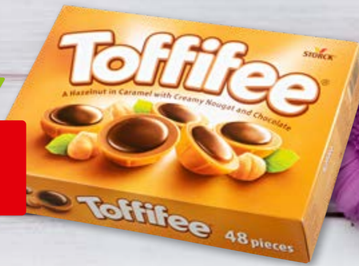
12819 Toffifee Storck 48 pièces