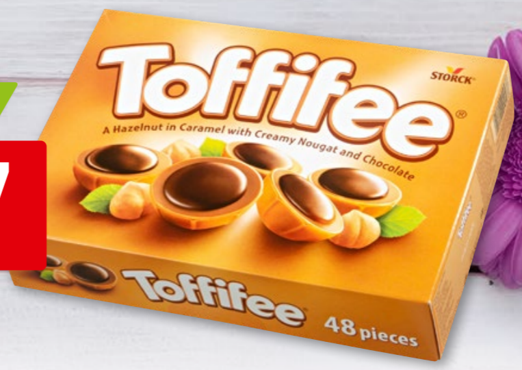
12819 Storck Toffifee 48 Stück