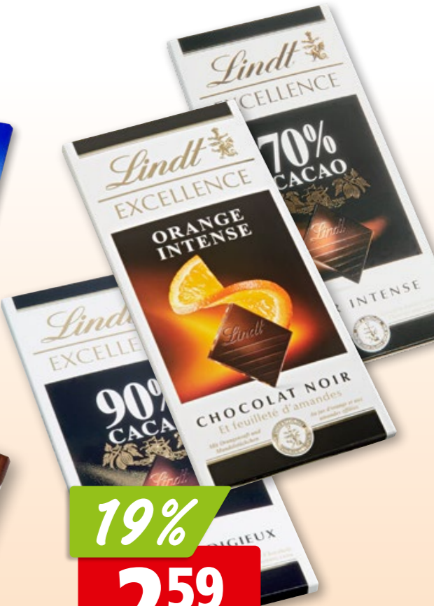
Lindt Milkschokolade extra 20 x