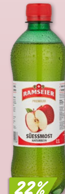
Ramseier Schorle 24 x