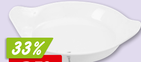
Mini Ramequin oder Löwenkopf Terrine aus Porzellan, 6 x